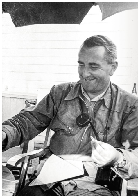
Emil Brunner, Tromsø 1953, Foto: Rolf Heyne «Telegrafenucht» © Fotostiftung Schweiz, Sammlung Hugger

fasst verschiedene Erlebnisräume: Im BSINTI-Ausstellungsraum für alpine Fotografie werden Bilddokumente aus Brunners Schaffen als reisender Foto-reporter und Bergsteiger präsentiert, während entlang der Spazierwege 30 Stationen mit berührenden Kinderporträts Einblick in den damaligen Kinderalltag von 1943/44 geben.